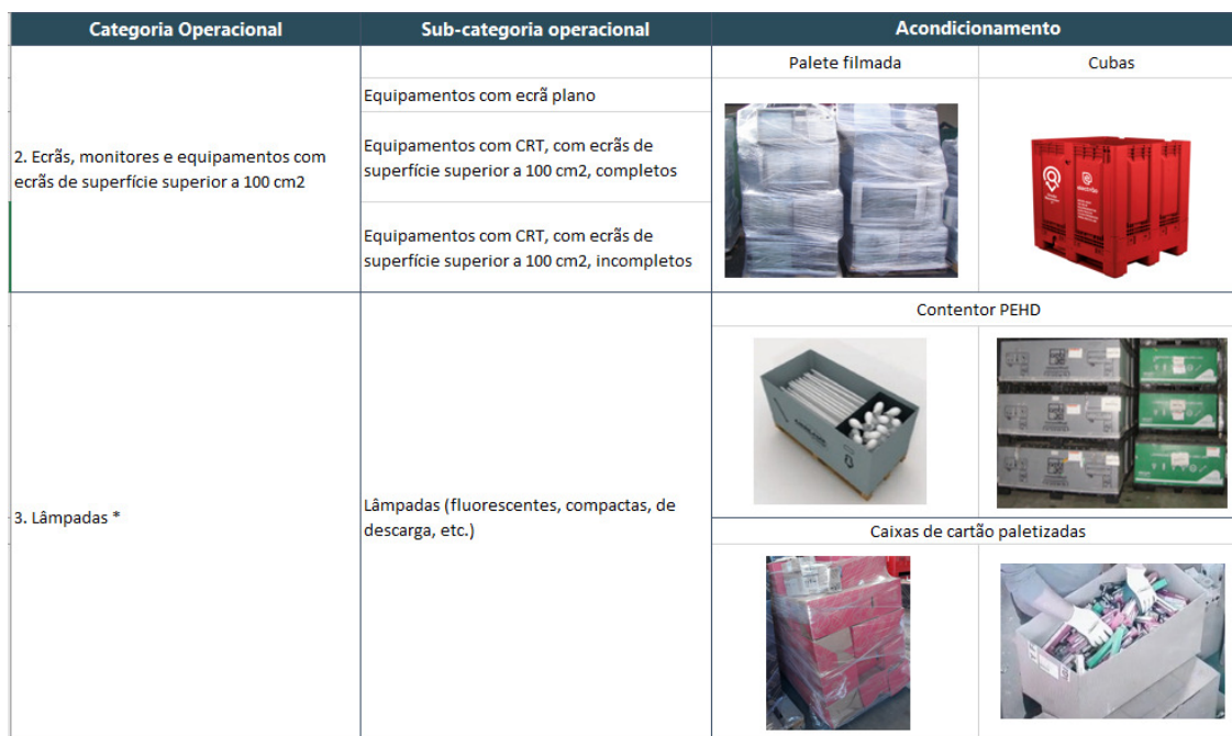
Tabela 2 – Meios de acondicionamento de entrega dos REEE

* No caso de lâmpadas não triadas as lâmpadas podem-se encontrar dentro das caixas de cartão do Electrão ainda dentro da sua embalagem de origem (embalagem de compra).